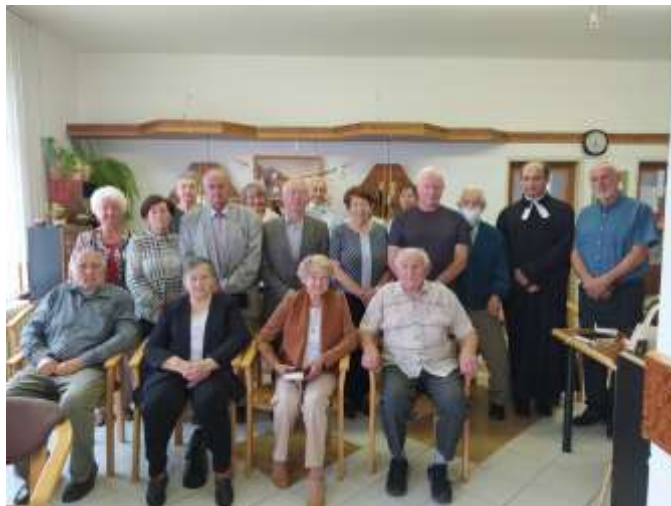
Spoločenstvo v Tlmačoch - Lipniku

V Zariasení sociálnych služieb Fénix v Leviciach sa konali služby Božie začiatkom roku, potom to už nebolo možné z hygienických dôvodov.